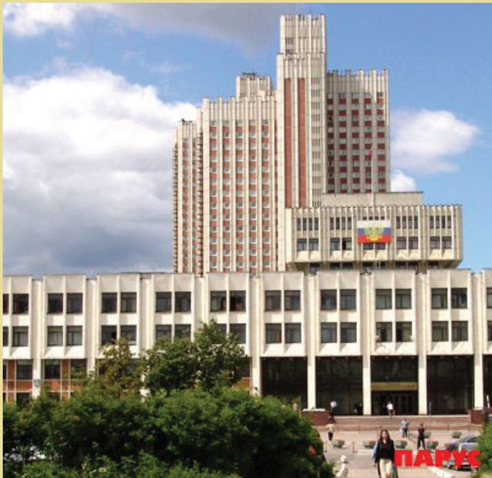
РАНХиГС при Президенте РФ